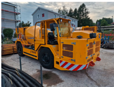
Tunnelfahrerischer 4 m 3