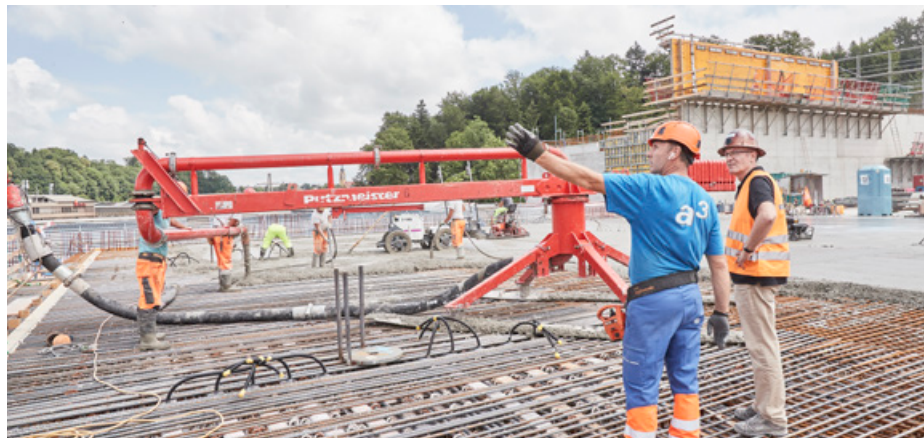
Rundverteiler mechanisch 10 m