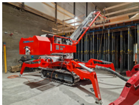
Rundverteiler hydraulisch Raupenfahrwerk 18 m